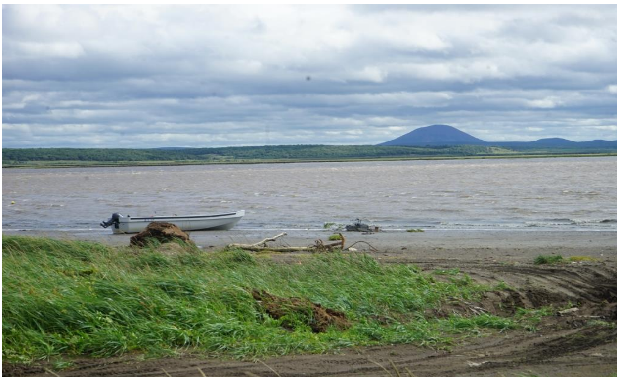
р. Хайрюзово близ поселка.

Договорившись со служащей и оставив все свои вещи в помещении почты, мы пешком отправились в совхоз на погранзаставу – нужно отдать свои пропуска и поставить в известность о своих планах. Когда-то, здесь были сосредоточены рыбообрабатывающие и консервные комбинаты. Кучи покореженного металла, ржавые баркасы, развалины домов – типичная, ставшая уже привычной картина, как напоминание об одной великой стране.