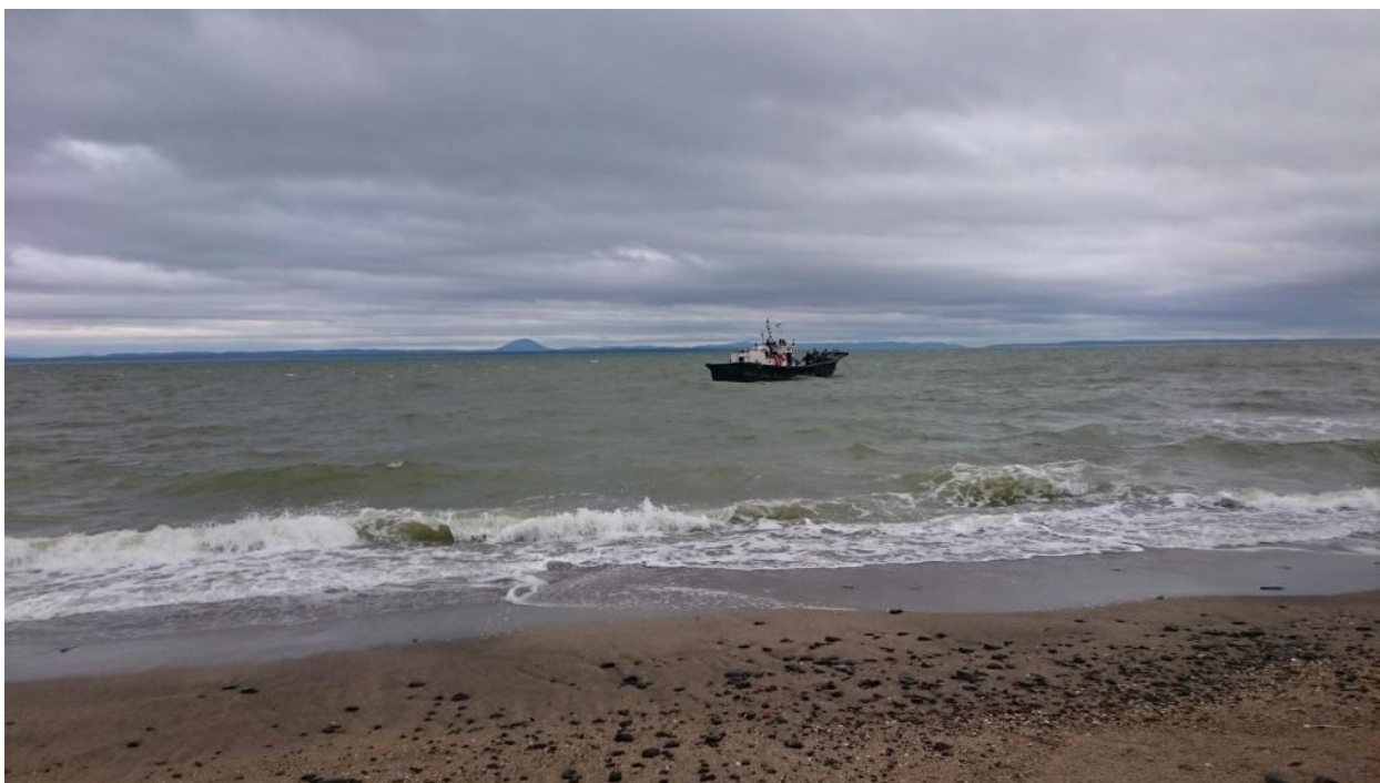
Место высадки и наш транспорт.