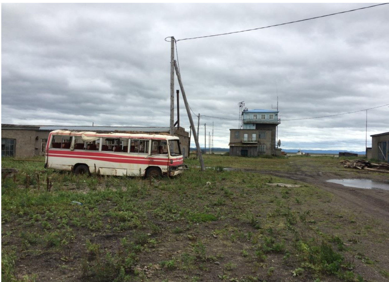
Пограничная застава пос. Усть-Хайрюзово.