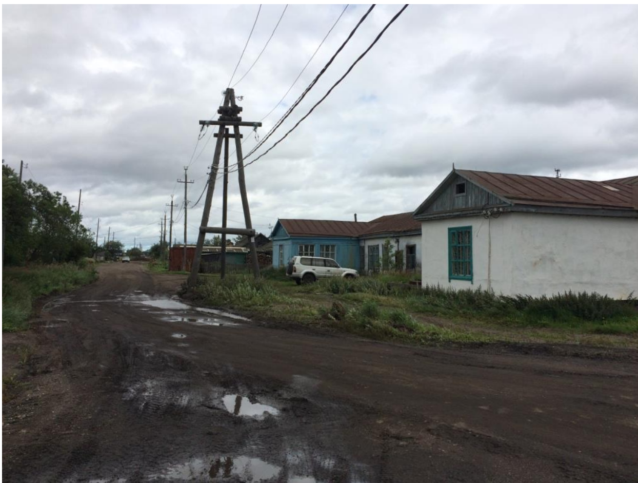
Улица в центре поселка.

Грунтовая взлетная полоса расположена непосредственно по соседству с жилыми домами, поэтому, выйдя за забор и пройдя около двухсот метров, мы оказались в самом центре этого довольно небольшого населенного пункта.