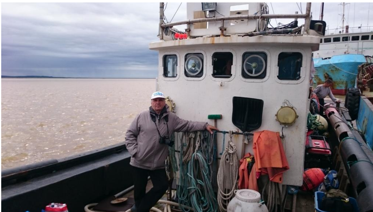
Владимир РК8А перед отходом на остров.

Опустив иные подробности, скажу, что через час мы уже были на «угольном» пирсе и грузили вещи и оборудование на корабль. Команда баркаса состоит из пяти человек – все являются сезонными рабочими из Петропавловска.