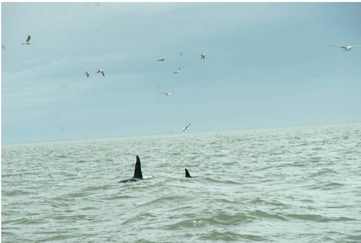
Касатки по пути на остров (Охотское море).

отчалили от берега. Прилив только начинался и уровень воды в реке был еще слишком мал, поэтому капитан очень осторожно вел судно по узкому фарватеру, дабы не сесть на мель. Тем временем ветер все крепчал, по воде побежали белые «барашки» - предвестник надвигающегося шторма! На выходе из устья реки в открытое Охотское море волнение увеличилось, баркас стал ощутимо крениться в разные стороны. Мы с тревогой вглядывались в горизонт, на юго-запад, откуда грозно и неумолимо ползли свинцовые тучи.