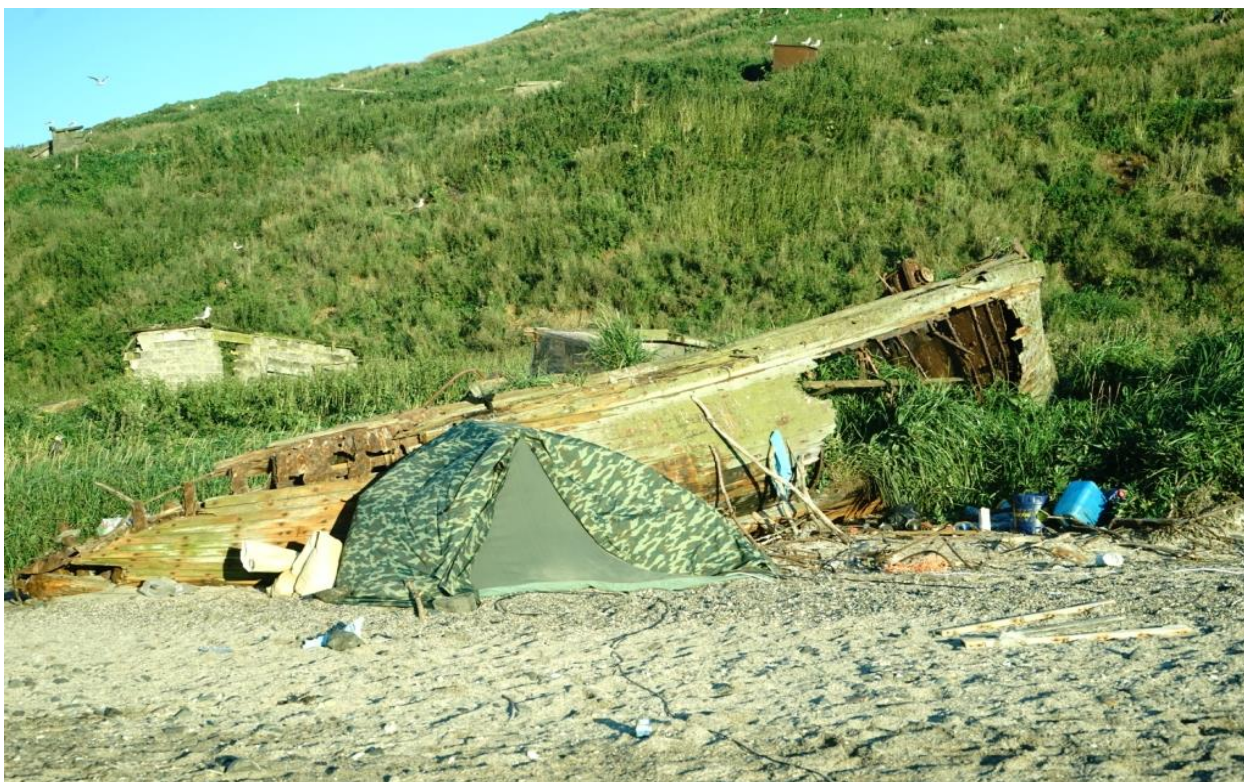
Общий вид нашего лагеря с установленной палаткой. День последний, солнечный.

Тем временем уже вечерело, и, дабы не заниматься установкой антенны под светом фонарика, спешно приступаем с Володей к монтажу вертикала. Под сильным дождем и шквальным ветром мы растягиваем фибергласовую удочку с полотном на 20-ти метровый диапазон недалеко от палатки, на полосе прилива. Для удержания оттяжек мы притащили большие тяжелые камни. Конечно, в качестве основной антенны планировалось использовать 2-х элементную VDA, но в таких погодных условиях об этом не могло быть и речи.