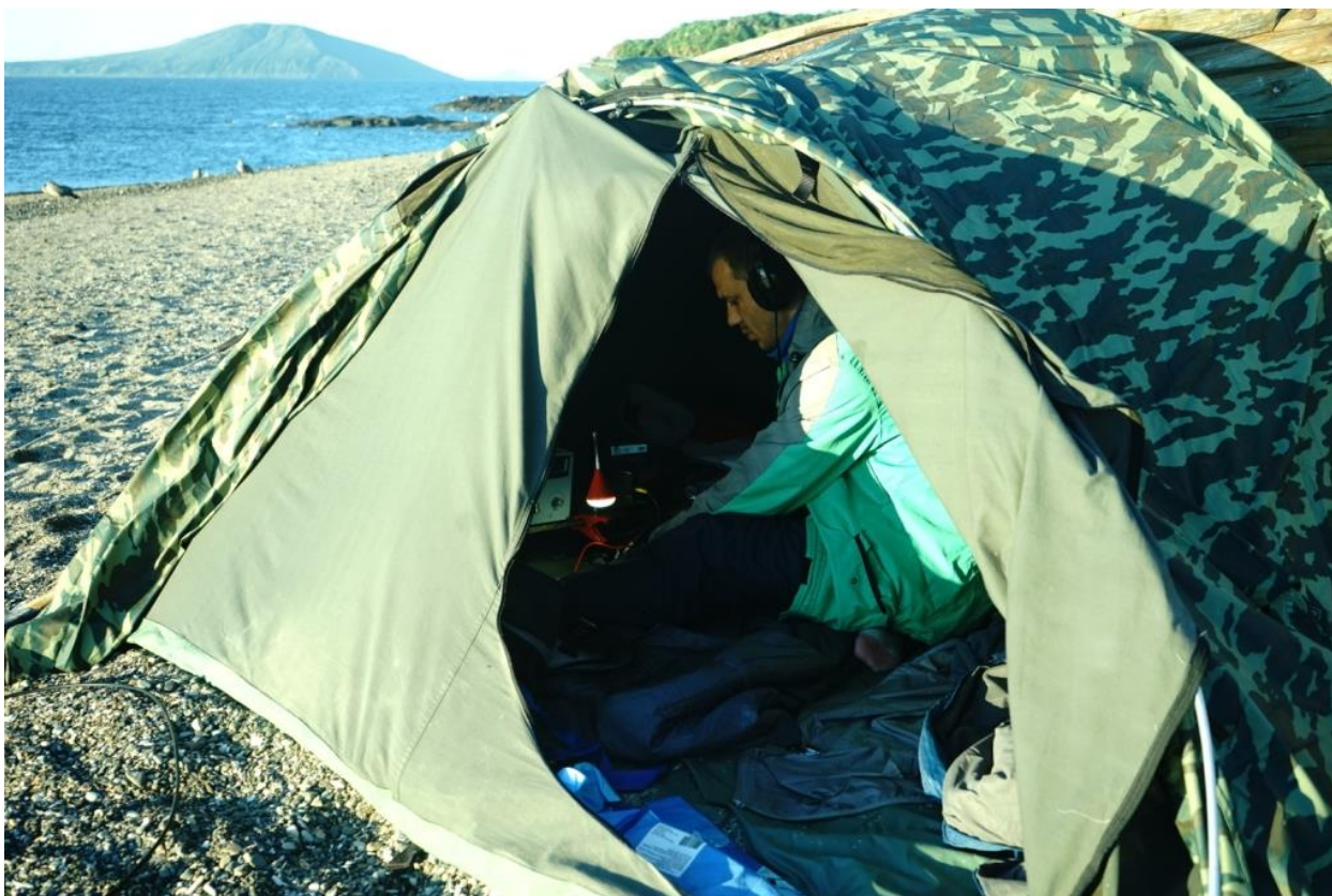
Рабочее место в палатке.

Но и это была не последняя беда. При включении усилителя, от высокого напряжения пробивает анодный дроссель на корпус. Вот это уже серьезно! В условиях значительной удаленности от Европы и Северной Америки остаться со 100 Ваттами выходной мощности нам бы весьма и весьма не хотелось. Но все же решаем отложить осмотр PA до утра, а пока начинать на «голый» трансивер.