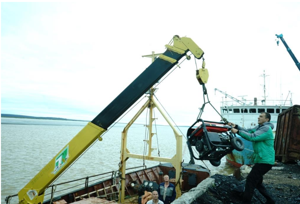
Погрузка генератора на баркас.

Опустив иные подробности, скажу, что через час мы уже были на «угольном» пирсе и грузили вещи и оборудование на корабль. Команда баркаса состоит из пяти человек – все являются сезонными рабочими из Петропавловска.