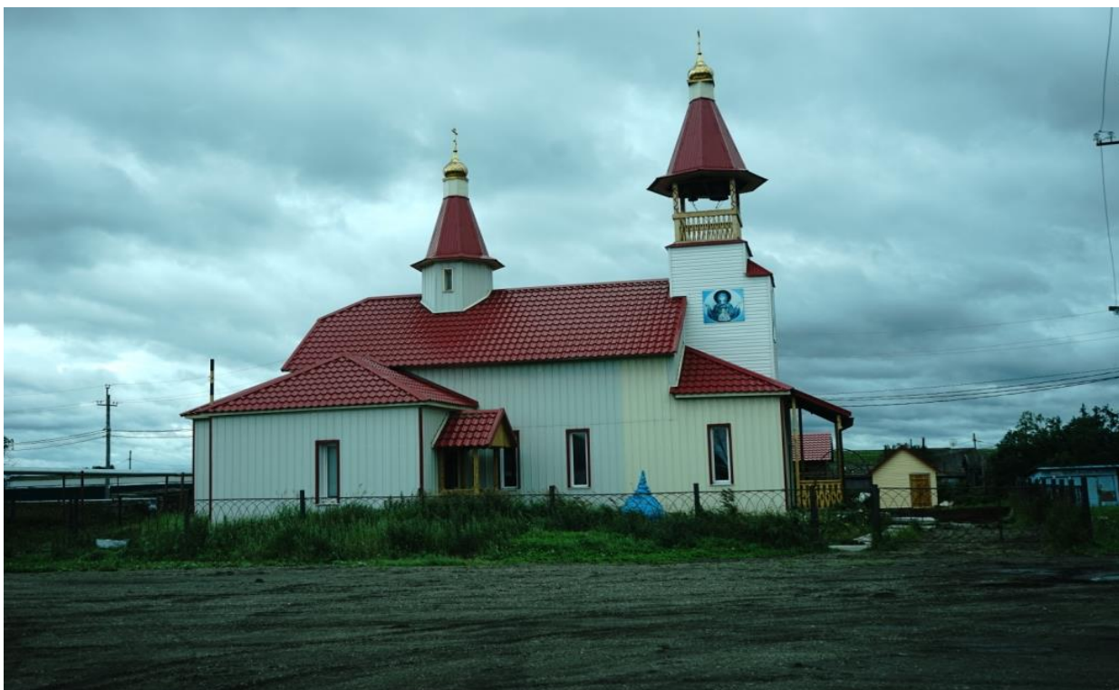
Новая часовня в поселке.

Договорившись со служащей и оставив все свои вещи в помещении почты, мы пешком отправились в совхоз на погранзаставу – нужно отдать свои пропуска и поставить в известность о своих планах. Когда-то, здесь были сосредоточены рыбообрабатывающие и консервные комбинаты. Кучи покореженного металла, ржавые баркасы, развалины домов – типичная, ставшая уже привычной картина, как напоминание об одной великой стране.