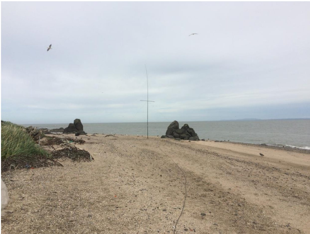
Антенна VDA на 20-ти метровый диапазон.

чтобы максимально открыть азимут на восточную Европу, т.е. на «наших».