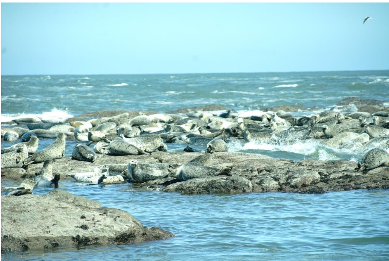
Большое лежбище нерп на западном берегу острова.

каменные завалы, о наличии которых я уже упоминал выше. Изучив рельеф более детально, мы были вынуждены констатировать, что наши вчерашние выводы полностью подтвердились – подняться вверх для нас абсолютно не представляется возможным. На северо-западной стороне острова мы обнаружили большое лежбище нерп, которые мирно грелись на солнце.