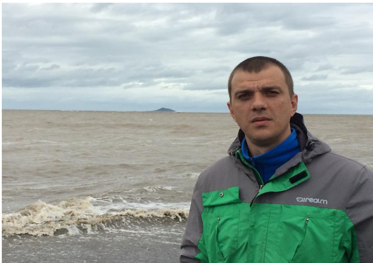
Устье р.Хайрюзово. На горизонте – о.Птичий.

Утешением нам послужило то, что ребята радушно предложили остановиться у них на съемной квартире, благо одна из 3-х комнат простаивает без дела. Нас, естественно, не пришлось уговаривать. Оставив часть вещей на заставе, мы отправились в свое временное жилище.