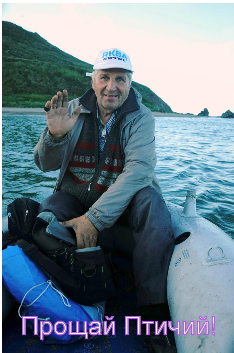
Владимир RK8A «снимается» с острова.

Так завершилась камчатская эпопея команды русских робинзонов. История тех, кому тесно в уютных и теплых постелях, кто тоскует по крику чаек и шуму прибора. История доброты, взаимовыручки и настоящей мужской дружбы. Мы с оптимизмом смотрим в будущее и жаждем новых приключений, так что до встречи в эфире!