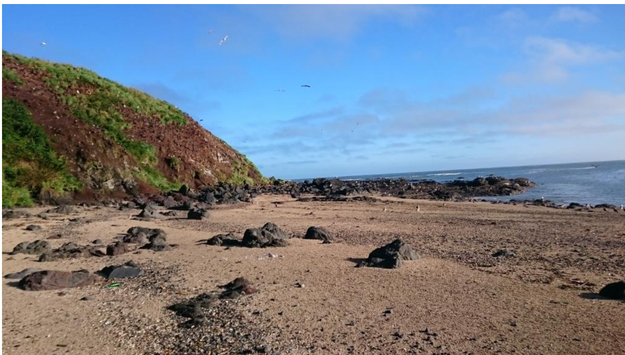
Прибрежный пейзаж острова