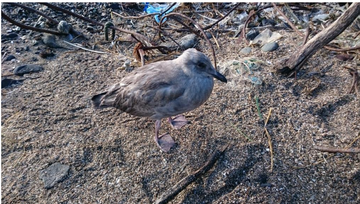
Чаеныши, доставлявшие нам много хлопот.